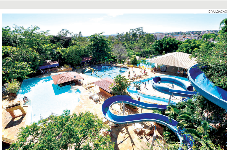
Com dezenas de atrações, o Acqua Park é um dos programas imperdíveis da cidade goiana