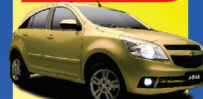
AGILE LT 1.4 2012

R$ 1.990+48X de apenas: R$ 799,00 +DH/VE/TE