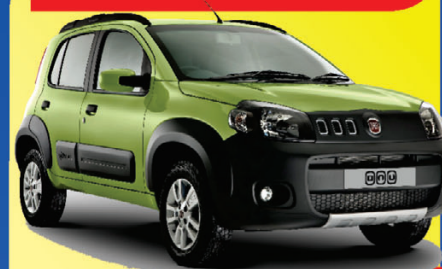
UNO VIVACE 2012