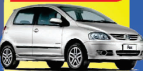
VW FOX 2004

À VISTA de apenas: R$ 14.990,00 +DH/VE/TE