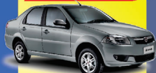
FIAT SIENA EL 2011

À VISTA de apenas: R$ 22.990,00 +DH/VE/TE