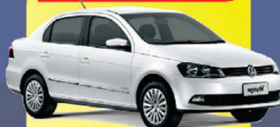
VW VOYAGE G6 2014

À VISTA de apenas: R$ 28.990,00 COMPLETO