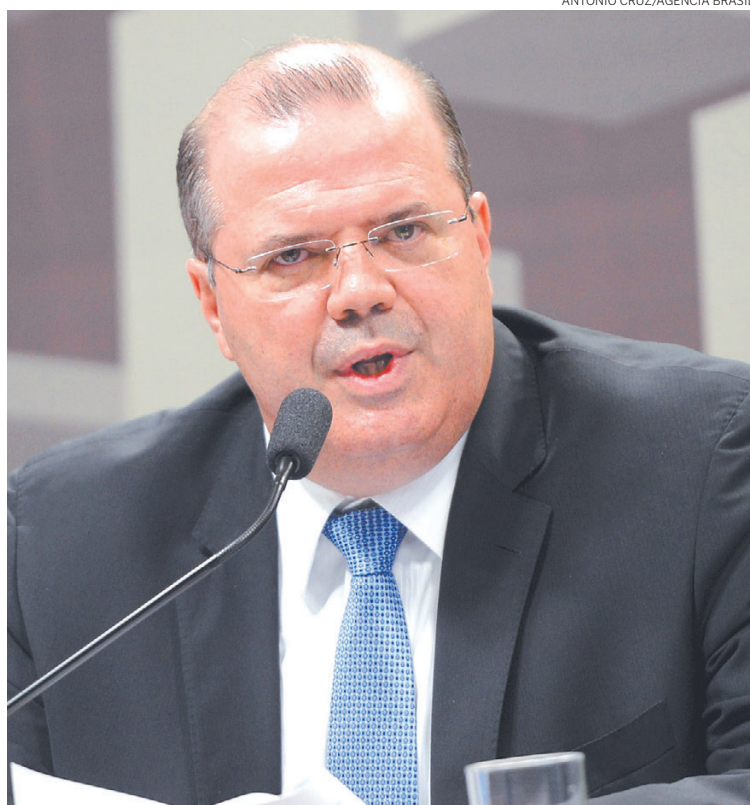
Nota de Tombini criou a expectativa por um aumento menor da taxa Selic

“Avaliando o cenário macroeconômico, as perspectivas para a inflação e o atual balanço de riscos,