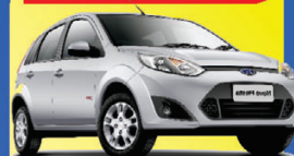
FIESTA ROCAM 1.6 2013

À VISTA de apenas: R$ 26.990,00 COMPLETO