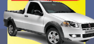
STRADA WORK 1.4 2011

À VISTA de apenas: R$ 20.990,00 +DH/VE/TE