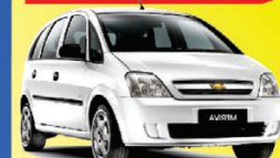
MERIVA MAXX 1.4 2010

À VISTA de apenas: R$ 23.990,00 COMPLETO