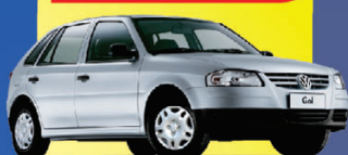
GOL G4 FLEX 2013