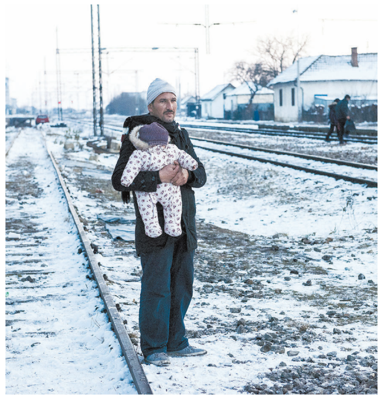
Refugiados procuram as estações de trem da Sérvia para deixar o país

À AFP, oficiais confirmaram o fechamento, que foi justificado pelos problemas e atrasos causados pelos imigrantes em linhas de trem que ligam o país a outros do leste europeu.