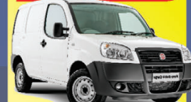
DOBLO CARGO 1.4 2013

À VISTA de apenas: R$ 30.490,00 COMPLETO