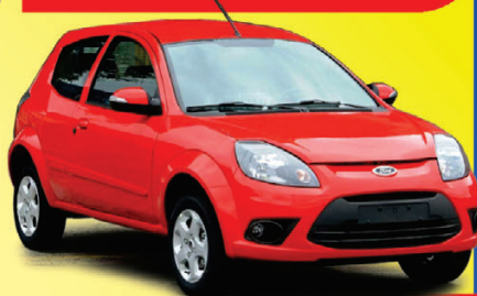
KÁ FLEX 2009