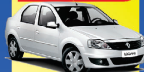
LOGAN EXPRE 2013

R$ 1.990+48X de apenas: R$ 739,00 COMPLETO