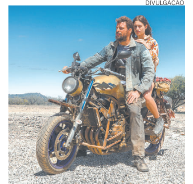
Ara (Cauã Reymond) e Laura (Luísa Arraes) em 'Reza a Lenda'

Cauã Reymond e Sophie Charlotte estrelam "Reza a Lenda", filme que chega hoje aos cinemas. Trata-se de um "road movie" que tem o sertão do nordeste como cenário. O longa marca a estreia de Homero Olivetto, roteirista de "Bruna Surfistinha", na direção de um longa de ficção.