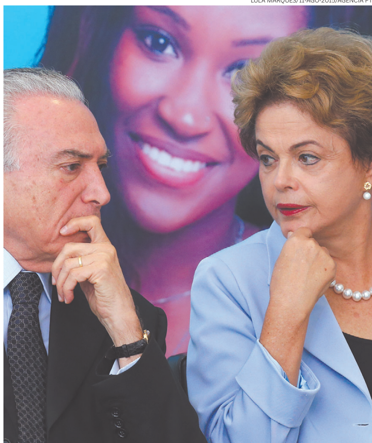
Interlocutores afirmam que Temer e Dilma não trataram sobre impeachment

No primeiro encontro entre a presidente e o vice depois de carta que consolidou racha, temas polêmicos foram evitados