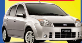
FIESTA HB 1.6 2008

R$ 1.990+48X de apenas: R$ 639,00 COMPLETO