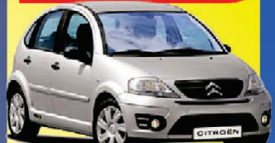
C3 GLX 1.4 FLEX 2007

R$ 1.990+48X de apenas: R$ 599,00 COMPLETO