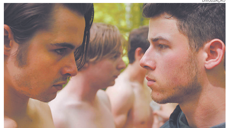
'Goat', com o cantor Nick Jonas (à dir.), é um dos destaques da programação

O diretor Whit Stillman ("Os Últimos Embalos da Disco") volta a reunir Kate Beckinsale e Chloe