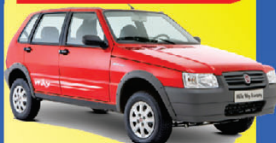
MILLE ECONOMY 2012

À VISTA de apenas: R$ 14.990,00 +DH/VE/TE