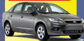
FOCUS SEDAN GLX 2.0 2013

À VISTA de apenas: R$ 38.490,00 COMPLETO