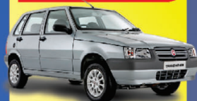
UNO MILLE 4P 2006

R$ 1.990+48X de apenas: R$ 799,00 +DH/VE/TE